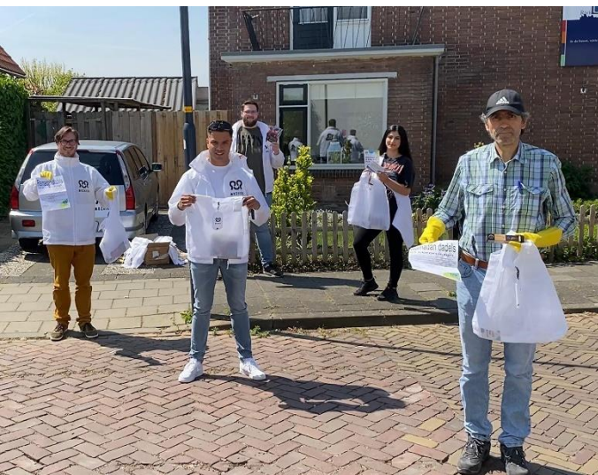
Uitdelen van dadels tijdens Ramadan in West Betuwe

'Onze organisatie is relatief klein, iedereen kent elkaar. De vader van een van onze medewerkers kreeg in de eerste golf corona, kwam in het ziekenhuis terecht, op IC en is uiteindelijk overleden. Dat had een flinke impact op ons allemaal. In het zuiden sloeg corona eerder toe dan in het noorden en het overlijden van die vader maakte dat heel concreet. Sindsdien is het meerdere keren gebeurd dat medewerkers dachten heb ik het of heb ik het niet en zich dan lieten testen. Het is een gesprek bij de koffieautomaat en online. Een van onze medewerkers is nu al een maand uit de running.'