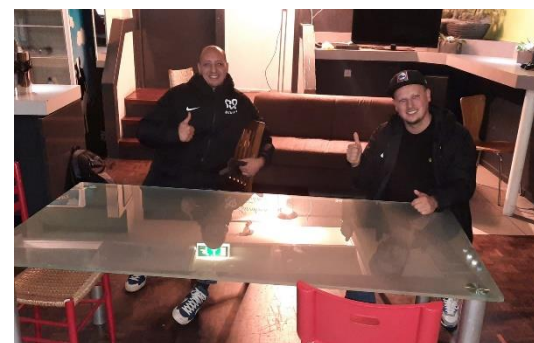
Jongerenwerkers in vroegere bioscoop

In de eerste golf toonden sociaal werkers zich creatief, innovatief en flexibel in hun inzet om met name kwetsbare inwoners en jongeren zo goed mogelijk te bedienen ten tijde van corona. Lukt dat ook nu weer? 'Tijdens die eerste golf waren sociaal werkers vaak de enige professionals die nog in de wijken kwamen. Vooral de jongerenwerkers en de opbouwwerkers. Iedereen zat verplicht thuis. In deze tweede golf is de lockdown minder consistent. Drie weken geleden kregen wij het verzoek van de gemeente om van een bioscoop - die failliet ging in de coronatijd - een pop-up jongeren centrum te maken. Op dinsdagmiddag om vijf uur hebben we de handtekeningen gezet en twee uur later kondigden Rutte en De Jonghe aanscherpingen van de